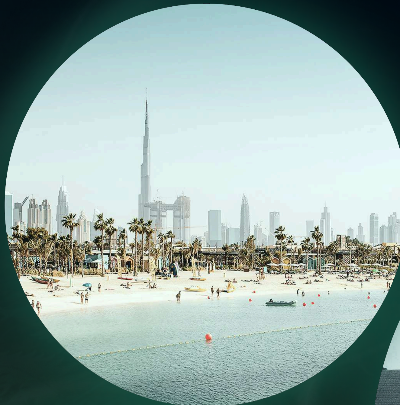
LA MER BEACH