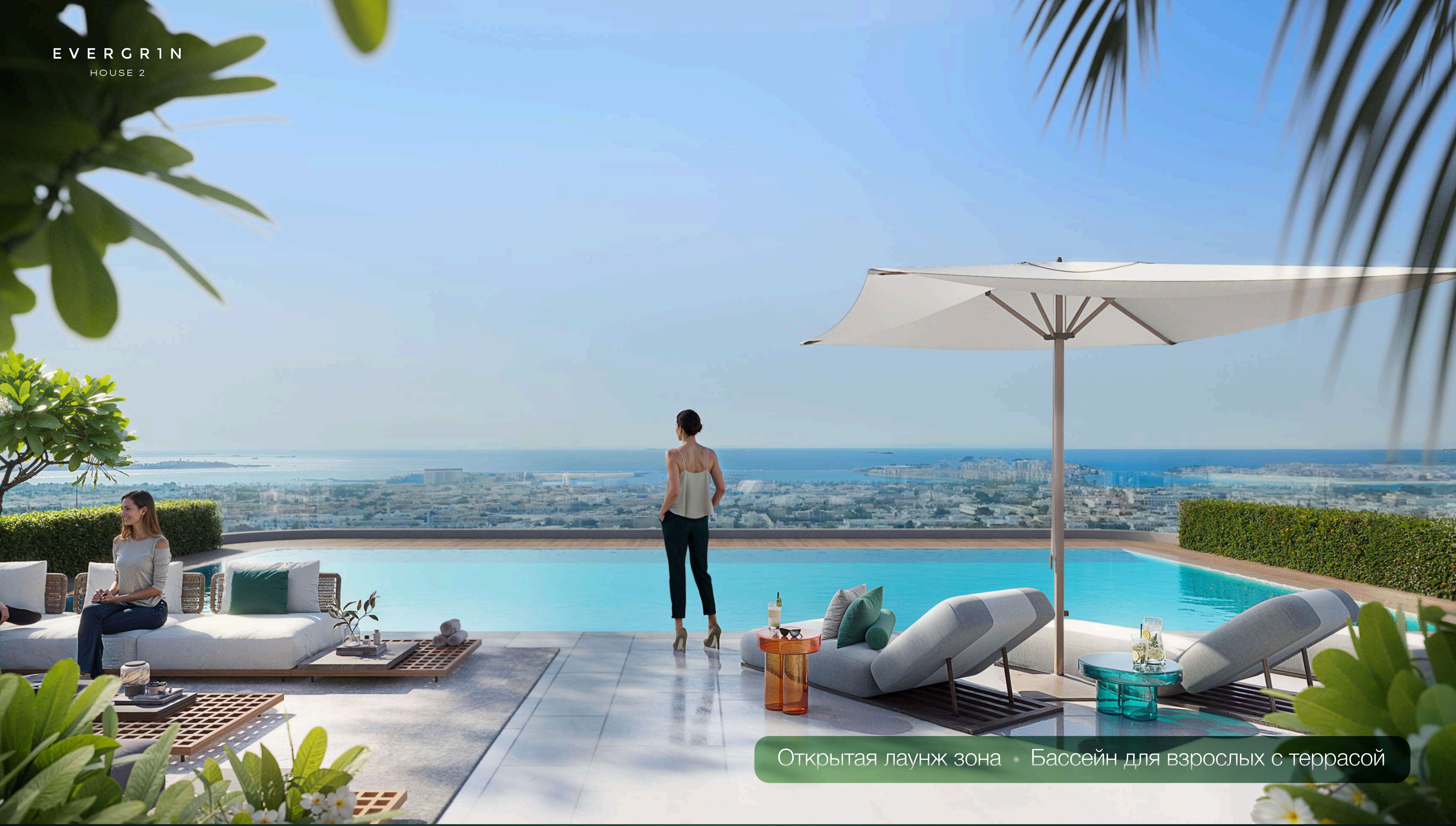
Открытая лаунж зона · Бассейн для взрослых с террасой