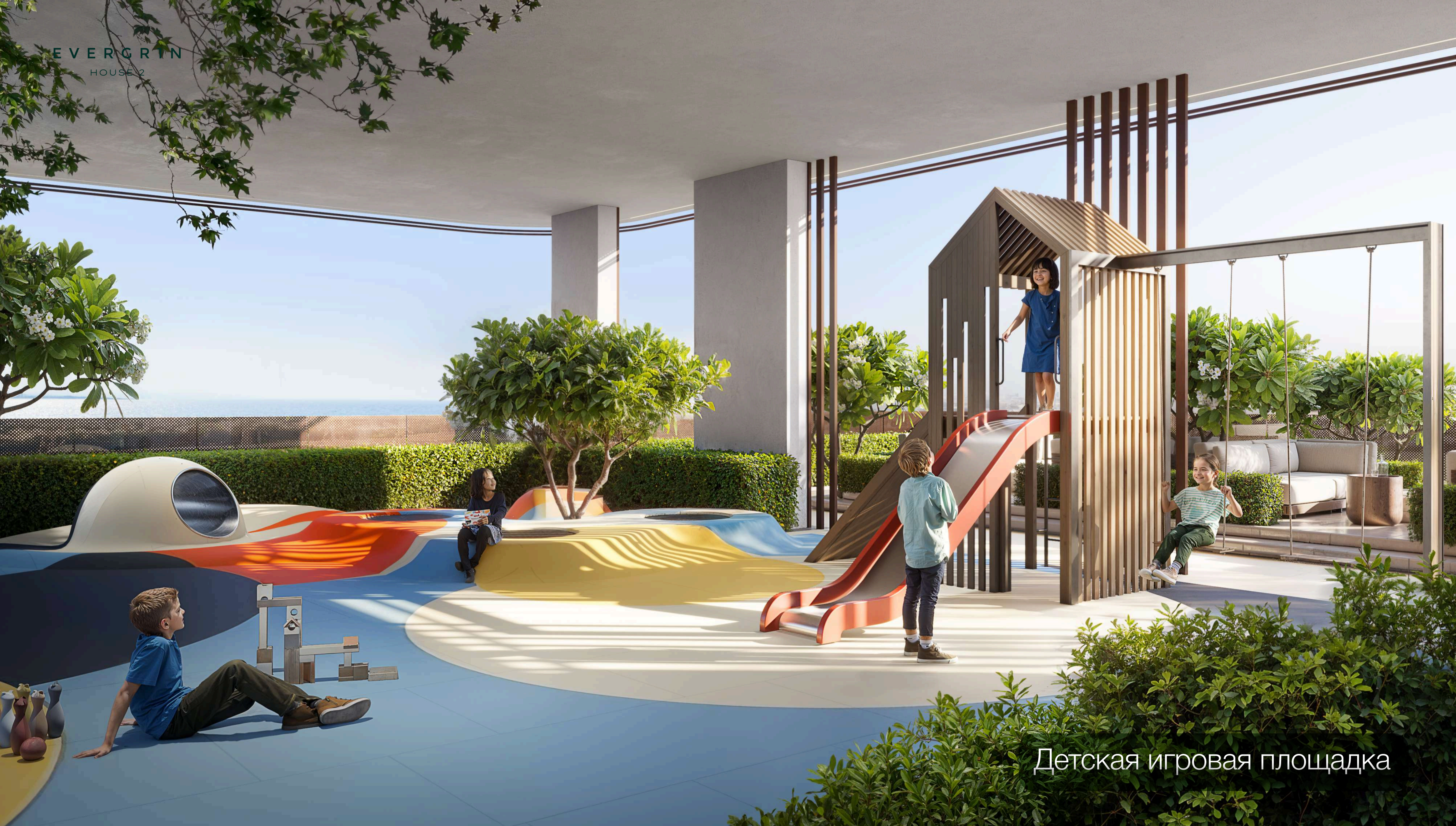
Детская игровая площадка