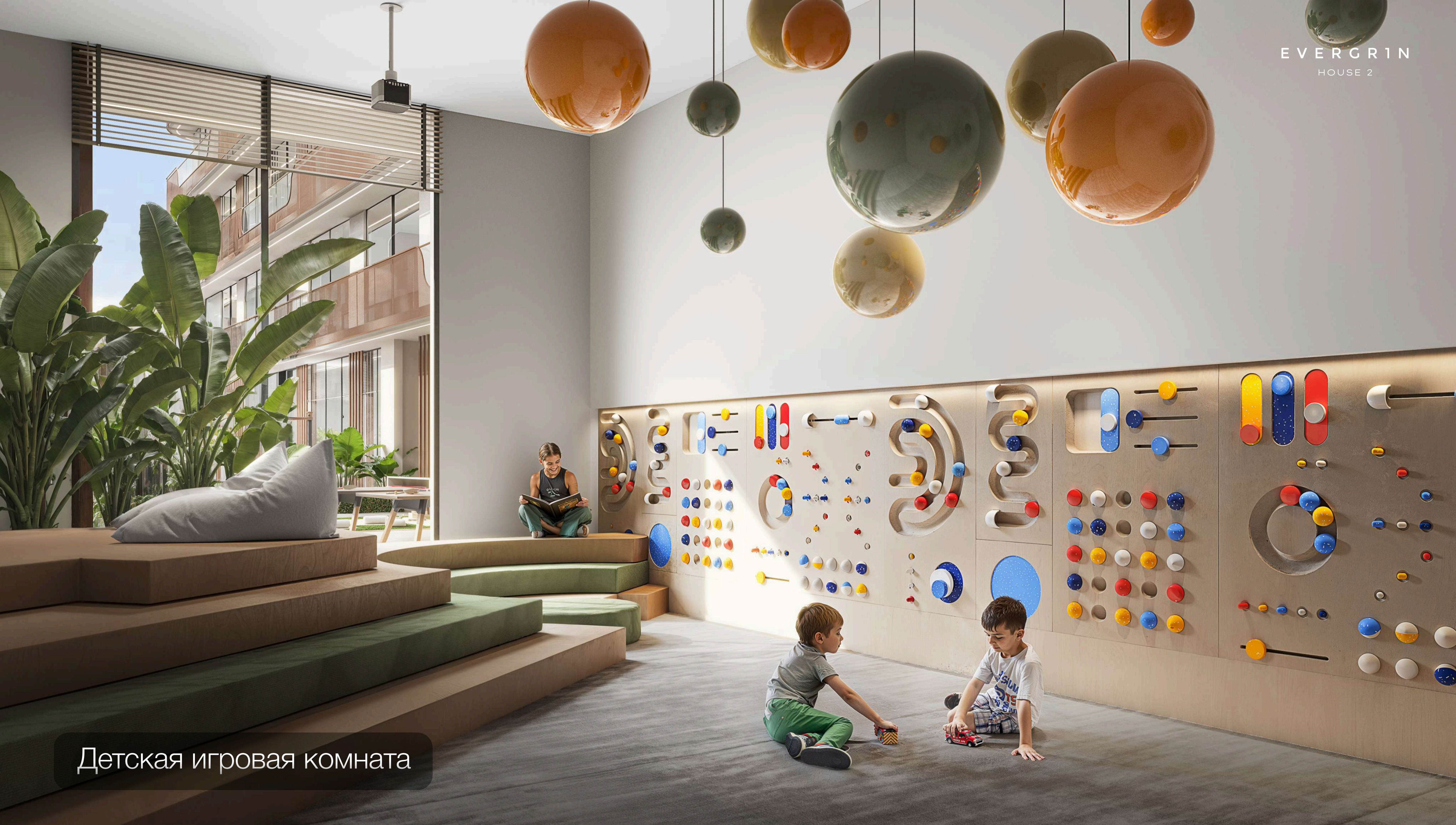
Детская игровая комната