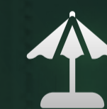
LA MER BEACH