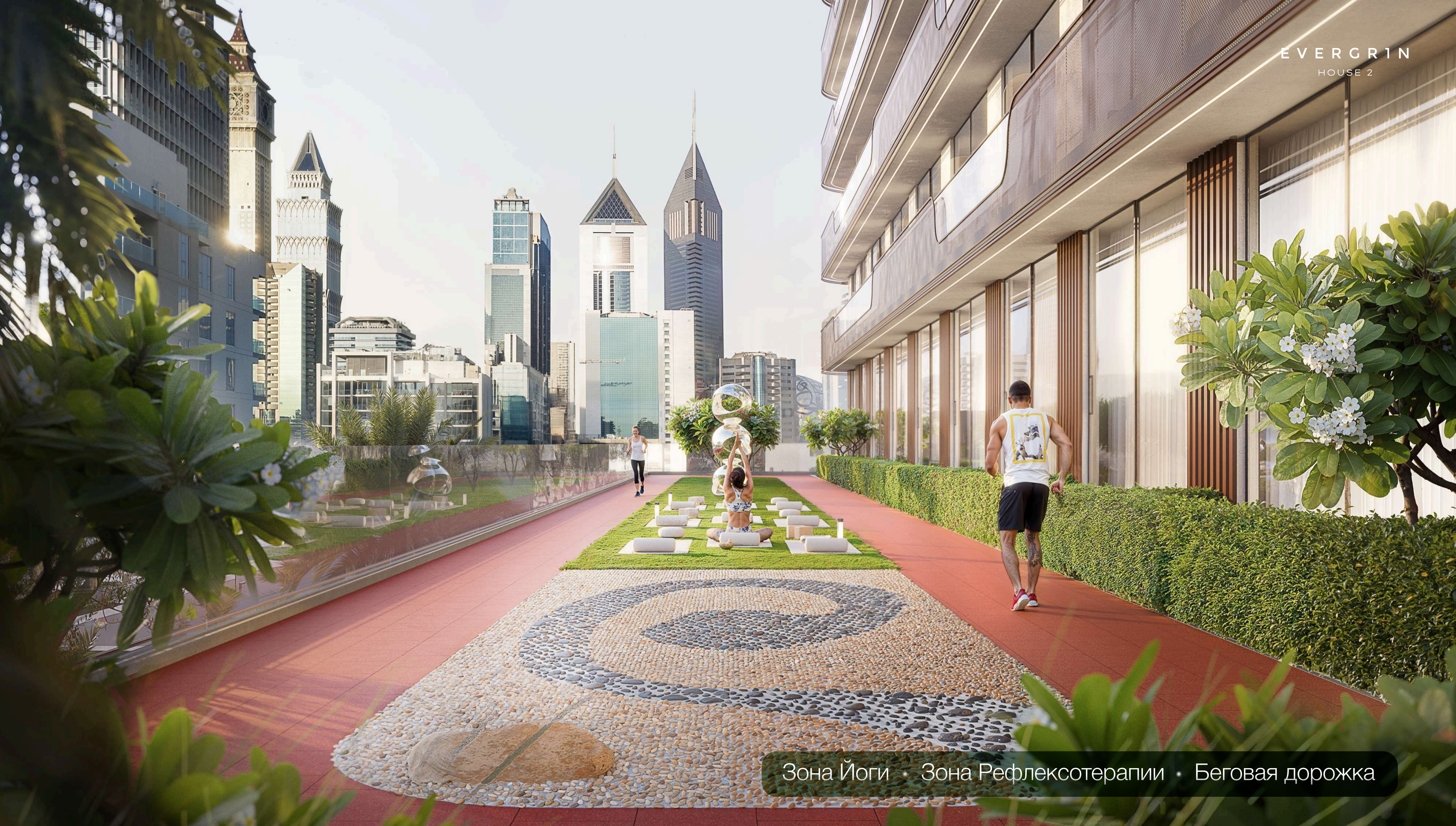
Зона Йоги • Зона Рефлексотерапии • Беговая дорожка