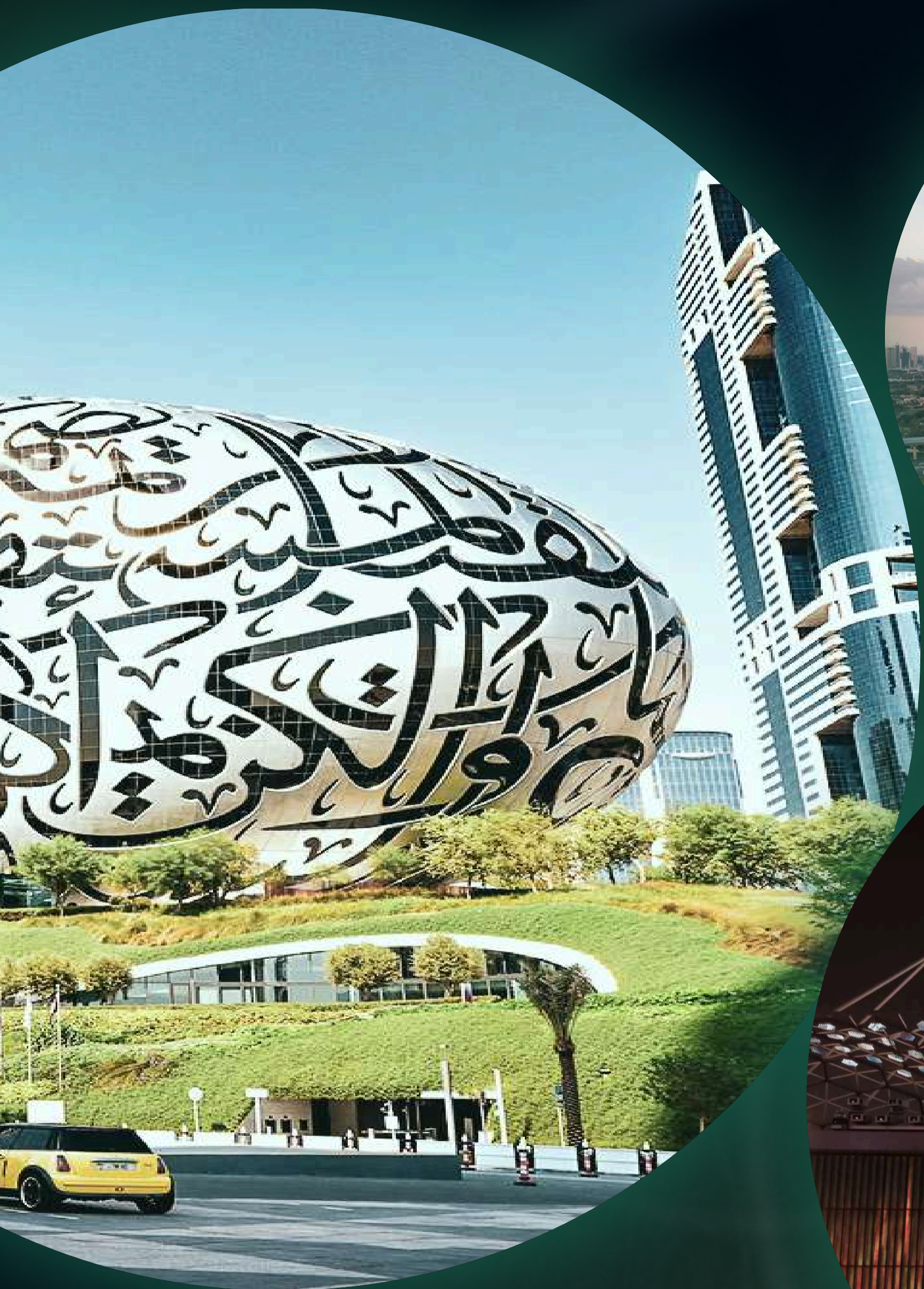
MUSEUM OF THE FUTURE